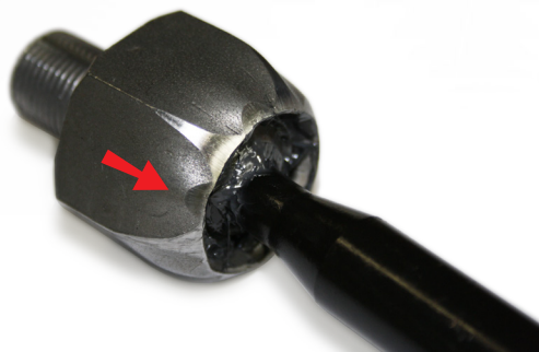
Рисунок 1: Оригинальная шестигранная конструкция.